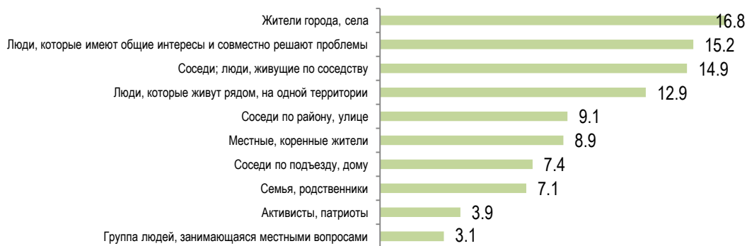
Рисунок 1: Как бы вы могли описать понятие «местное сообщество»? В %. N=610