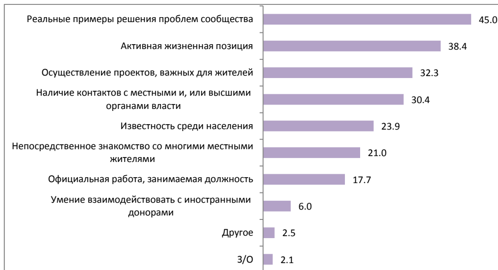
Рисунок 4. Какими качествами, компетенциями должен обладать человек, претендующий на роль лидера местного сообщества, чтобы Вы могли ему доверять? В %. N=610

Белорусы не знают лидеров в своих местных сообществах. Абсолютное большинство белорусов (95,3%) не смогли назвать лидера местного сообщества, к которому они себя относят. При этом респонденты уверенно определяют ключевые качества, которыми должен обладать местный лидер. Реальные примеры решения проблем сообщества, наличие контактов с органами власти, известность среди населения и знакомство с местными жителями вошли в «топ 5» компетенций лидера местного сообщества. Наличие у местного лидера официального места работы (17,7%) значительно важнее для белорусов, нежели его или ее контакты с иностранными донорами (6%).