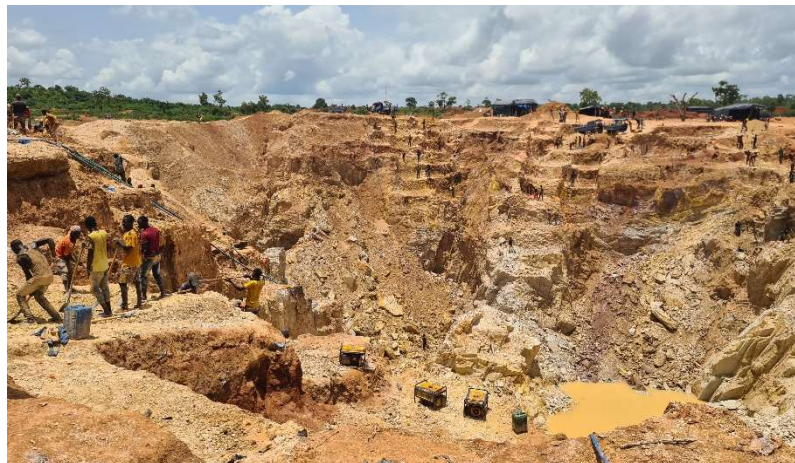
Mine d'or artisanale dans le Cercle de Kangaba, Mali.

Les partenaires du projet commencent par consulter l'ensemble des acteurs gouvernementaux et de la société civile concernés dans chaque pays afin de : i) planifier les activités du projet en fonction des priorités nationales ; i) sensibiliser aux impacts environnementaux de l'orpaillage et à l'importance de sa formalisation. Ils se rendront ensuite dans les communautés pratiquant l'orpaillage dans les zones frontalières ciblées par le projet afin de réaliser une analyse intégrée (voir la carte à la page 2). Cette analyse permettra d'évaluer le contexte politico-économique du secteur régional de l'orpaillage, les besoins des communautés et leurs moyens de subsistance, ainsi que leur vulnérabilité face à des facteurs, tels que le changement climatique et les dynamiques conflictuelles locales. Pact renforcera également les capacités de ses partenaires locaux afin de leur permettre de poursuivre les progrès après la fin du projet.